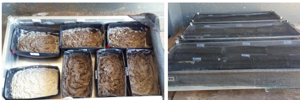
Figura 1. Reatores instalados no interior de banheiras (a) e cobertos com sombrite (b).

Após realização das misturas, os compostos foram acondicionados em recipientes plásticos (reatores) com capacidade volumétrica de aproximadamente 0,05m 3 , cortadas longitudinalmente (Figura 1). A fim de se facilitar manuseio e/ou evitar possíveis acidentes, bem como evitar proliferação de insetos e predação do material, estes reatores foram suspensos do chão 20 centímetros, acondicionados em banheiras e cobertos com sombrite 65%, permanecendo em ambiente coberto durante todo o período experimental.