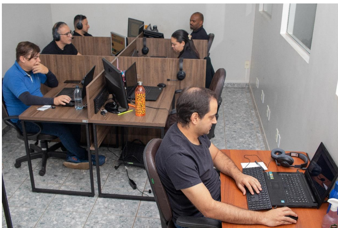
Figura 2 – Ambiente de Trabalho

Pioneirismo em Ação: Sob minha gestão (figura 2), estabelecemos a eSolution como uma referência incontestável na indústria de hospitalidade. Nossa busca incessante pela inovação e tecnologia catalisou o crescimento acelerado desse setor, proporcionando soluções de software inovadoras e eficazes.