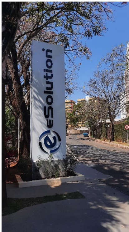
Figura 1 – Totem na frente da empresa