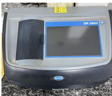
Figura 6 – Espectrofotômetro utilizado na determinação do teor de clorofila em óleo de soja.