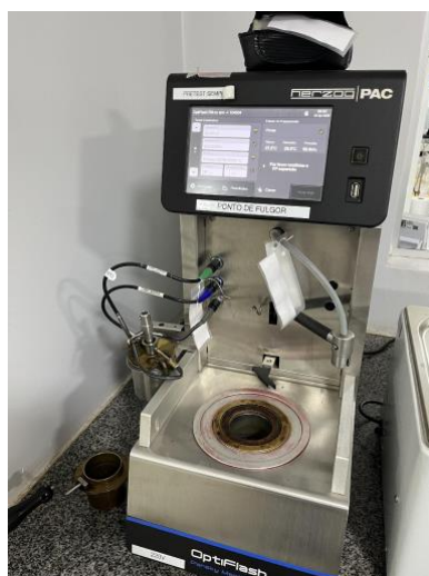
Figura 8 – Equipamento para determinação do ponto de fulgor do biodiesel em vaso fechado.