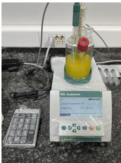
Figura 10 – Titulador Karl Fischer Coulométrico utilizado na determinação do teor de água (método ASTM D6304).