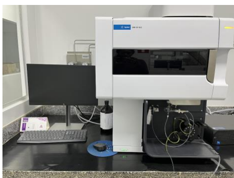
Figura 5 – Espectrômetro de emissão óptica com plasma indutivamente acoplado (ICP-OES) utilizado na determinação de fósforo.