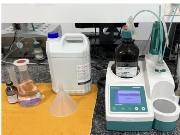
Figura 3 – Sistema de titulação utilizando solução alcoólica, fenolftaleína como indicador e solução de NaOH para determinação de acidez.

Para o óleo de soja, foram conduzidas análises de umidade, acidez, teor de sabões, fósforo e clorofila. Esses parâmetros são essenciais para o controle das etapas de refino, uma vez que influenciam diretamente a eficiência do processo e a qualidade do produto final. As análises do óleo seguiram a mesma frequência adotada para a soja, sendo realizadas três vezes ao dia, permitindo o monitoramento sistemático das condições do processo. Os equipamentos utilizados nessas determinações incluem tituladores, espectrofotômetros e outros dispositivos laboratoriais, conforme ilustrado nas Figuras 3 a 6.