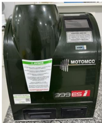
Figura 1 – Equipamento Motomco para determinação de umidade em grãos.

No que se refere à matéria-prima soja, foram realizadas análises de umidade, extrato etéreo e teor de proteína, parâmetros fundamentais para a avaliação da qualidade do grão e de seu potencial de processamento industrial. Essas análises eram realizadas com três vezes ao dia, correspondendo a uma análise por turno de produção, garantindo o acompanhamento contínuo da matéria-prima recebida e processada. Para a determinação desses parâmetros, foram utilizados os equipamentos Motomco e Nirs para análises rápidas de umidade, extrato etéreo e proteína bruta, conforme apresentado nas Figuras 1 e 2.