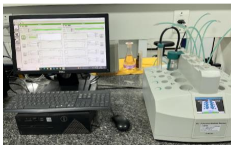
Figura 7 – Equipamento Rancimat utilizado na determinação da estabilidade oxidativa do biodiesel.

Assim, enquanto as análises completas eram realizadas em todos os lotes produzidos, assegurando a conformidade do biodiesel com as especificações da ANP, as análises de rotina atuavam como ferramenta de controle operacional contínuo, contribuindo para a estabilidade do processo e a padronização da produção. Os principais equipamentos utilizados nessas análises para certificação estão apresentados nas Figuras 7 a 10.