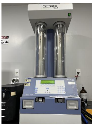
Figura 9 – Viscosímetro utilizado na determinação da viscosidade cinemática a 40°C do biodiesel.