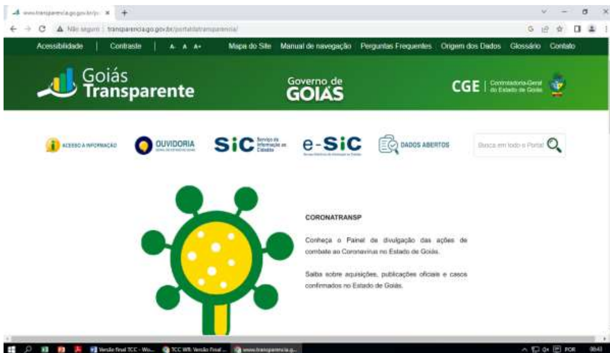
Figura 2 – Interface do Portal da Transparência do Governo do Estado de Goiás