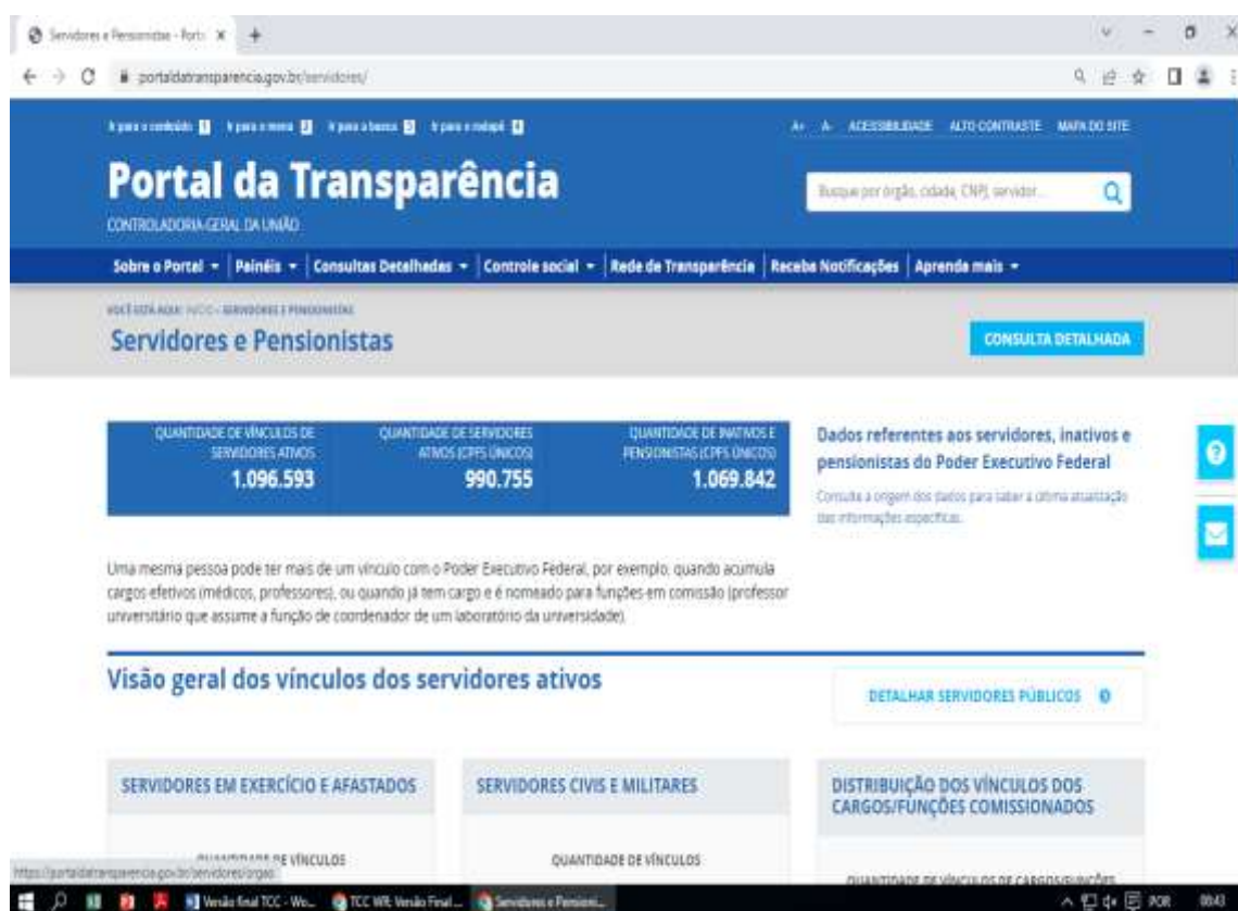
Figura 1 – Interface do Portal da Transparência do Governo Federal