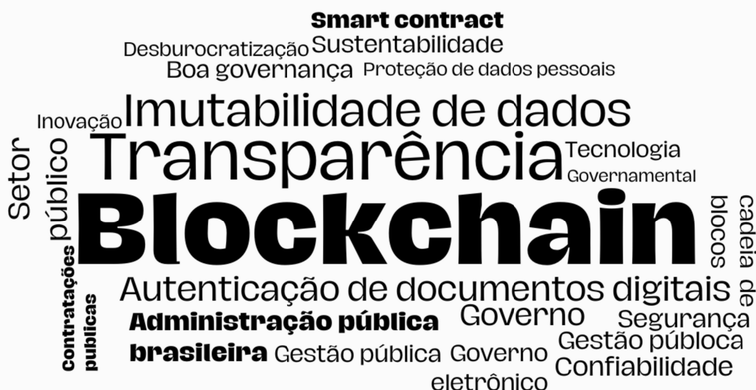
Figura 3 – Nuvem de palavras-chave dos artigos analisados