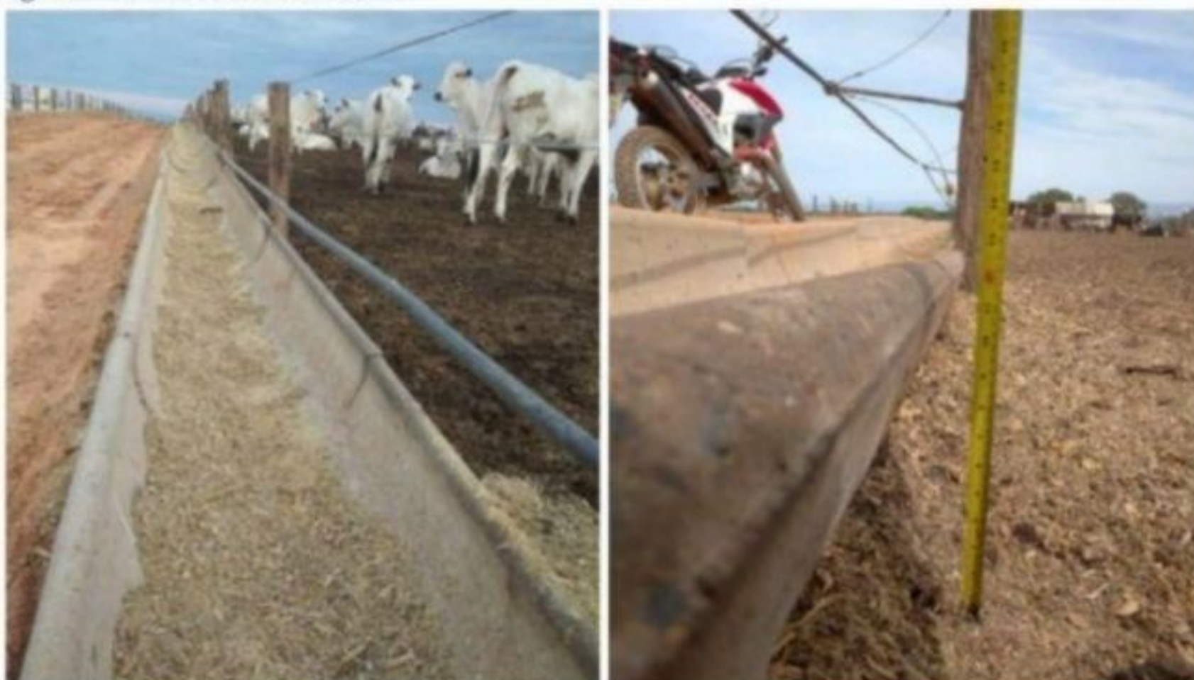
Figura 7 - Análise de altura de cocho.

Outro fator identificado no confinamento foi em relação às sobras de cocho, pois foi observado no decorrer dos dias um desnível de altura dos cochos, alguns currais apresentaram a maior parte das sobras nas partes mais baixas, com altura entre 20 a 30 centímetros.