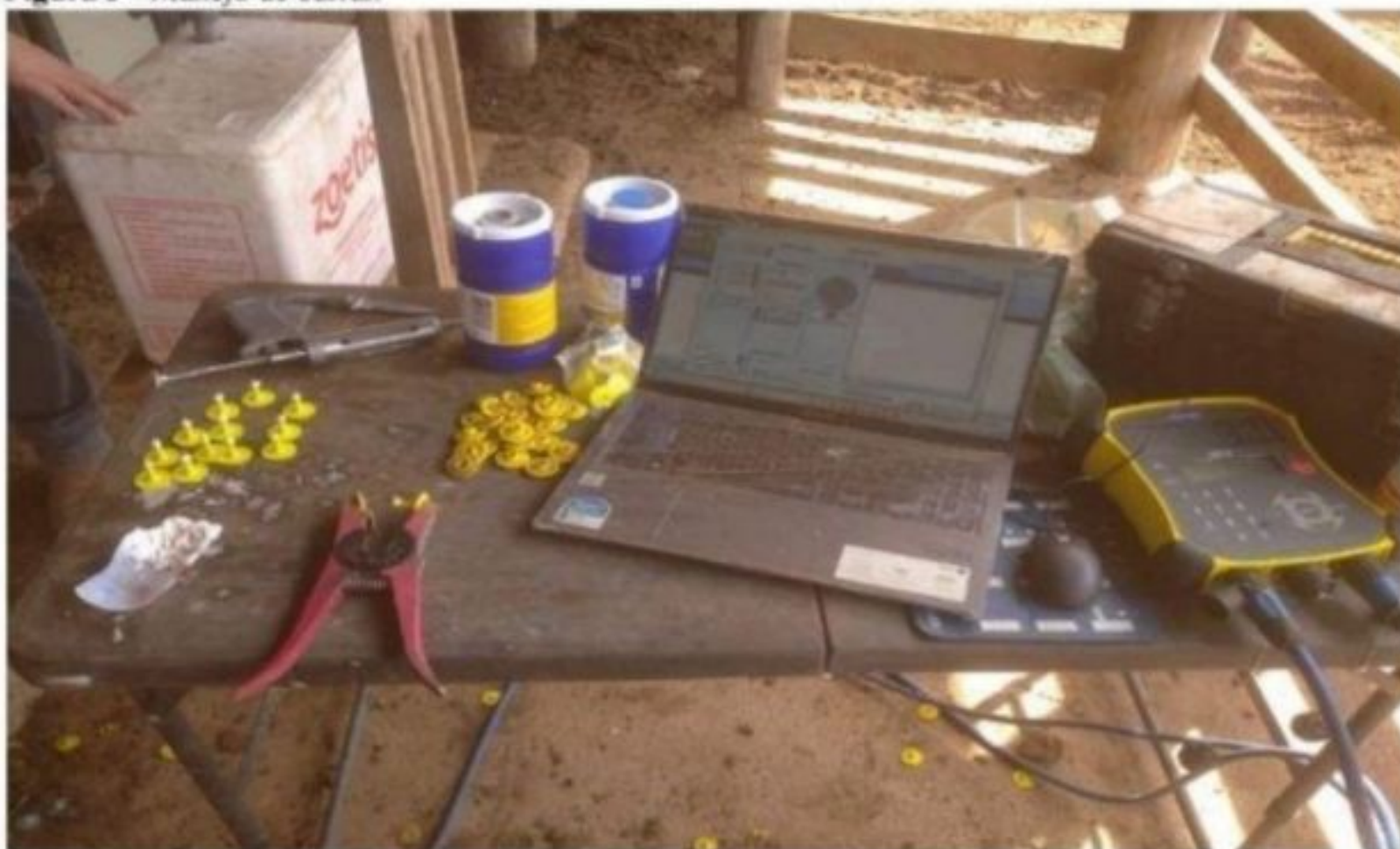
Figura 3 - Manejo de curral.

No manejo de inclusão de animais foi realizada a aplicação de brincos eletrônicos na orelha esquerda, para a identificação dos mesmos, adicionando raça, peso, categoria, e localidade do animal no sistema, além do manejo sanitário de entrada.