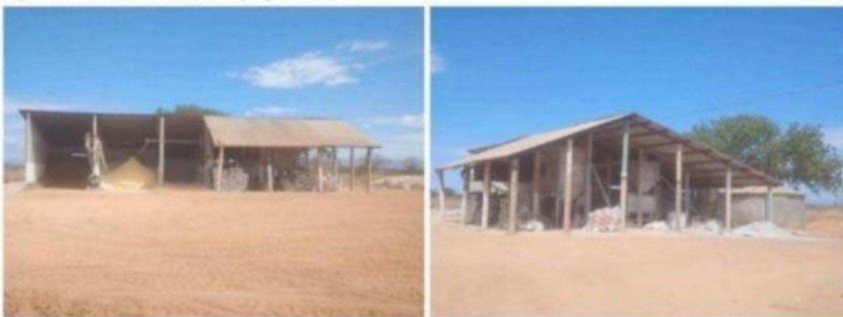
Figura 2 - Fábrica de Ração da propriedade.

A produção do concentrado é realizada na própria fazenda. É feita a compra de insumos semanalmente, pois a estrutura não comporta grandes quantidades armazenadas. Assim é produzido uma pré-mistura dos ingredientes de menor proporção para facilitar o carregamento do vagão, como a ureia, calcário calcítico, núcleo e uma pequena porção do milho moído, compondo 3% da dieta.