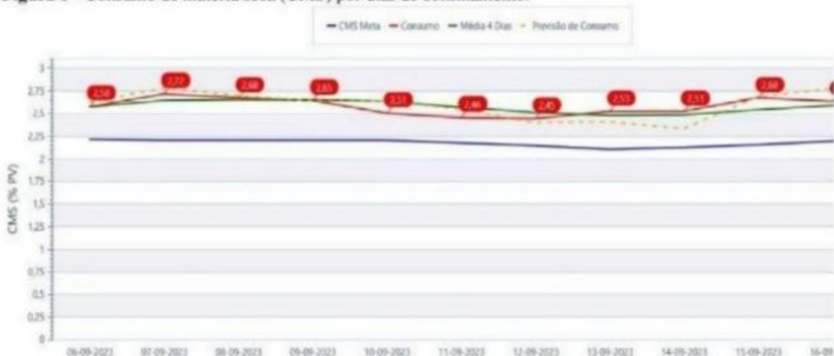
Figura 6 - Consumo de matéria seca (CMS) por dias de confinamento.

Ocorreu no confinamento a falta de insumos, pois foi realizada a compra de torta de algodão para trocar a fonte de proteína, que acabou atrasando a entrega. Como solução imediata, houve a substituição do DDG por farelo de soja pelo período de um dia, até que a torta chegasse. O que acabou ocasionando uma redução no consumo de matéria seca de 8%, caindo de 2,65% para 2,45% do peso vivo (PV), como é mostrado no gráfico abaixo.