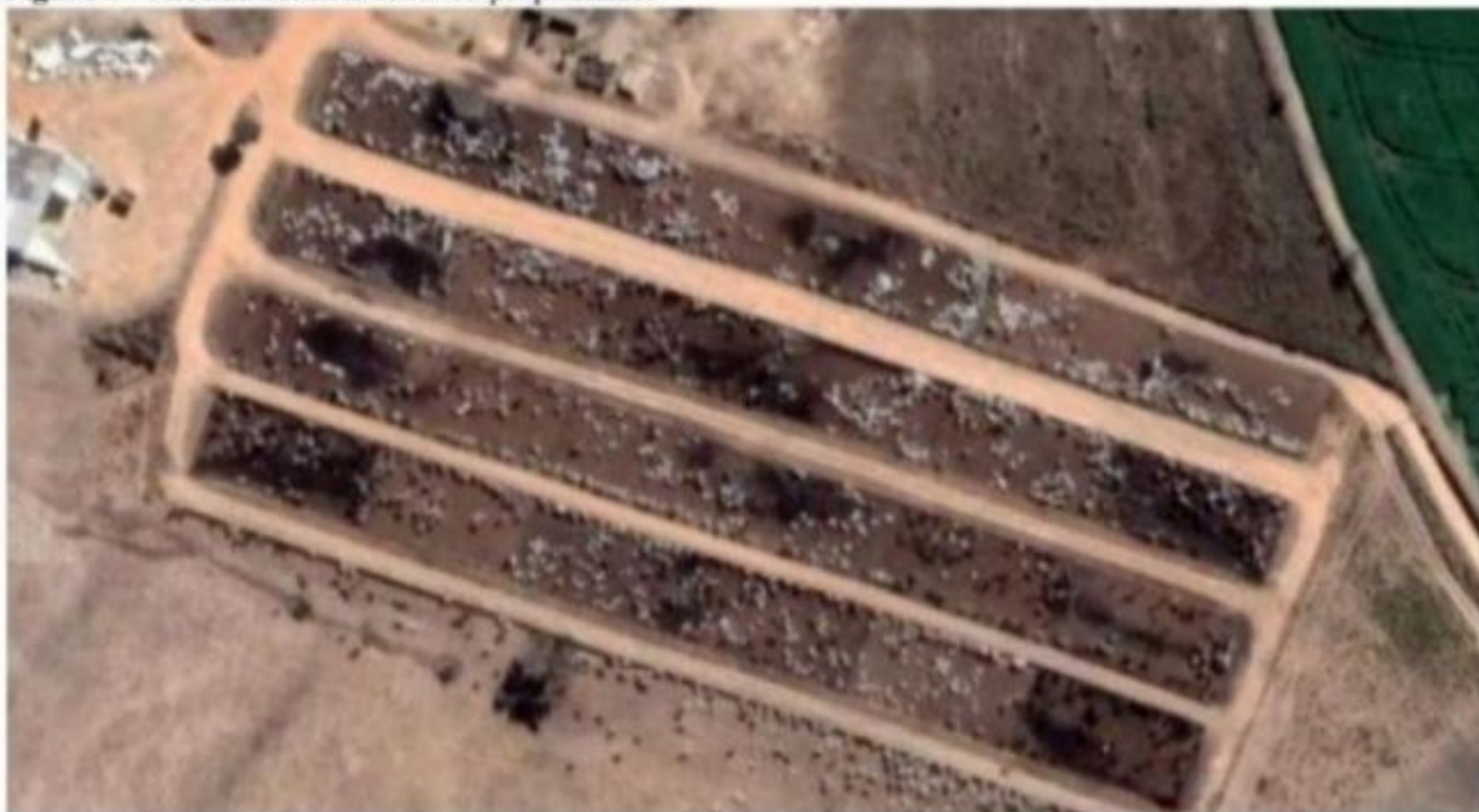
Figura 1 - Área de confinamento da propriedade.

O confinamento é composto por quatro linhas de seis de currais cada uma, totalizando 24 currais, cada curral possui uma linha de cocho de 40 metros, e cerca de 800 m 2 .