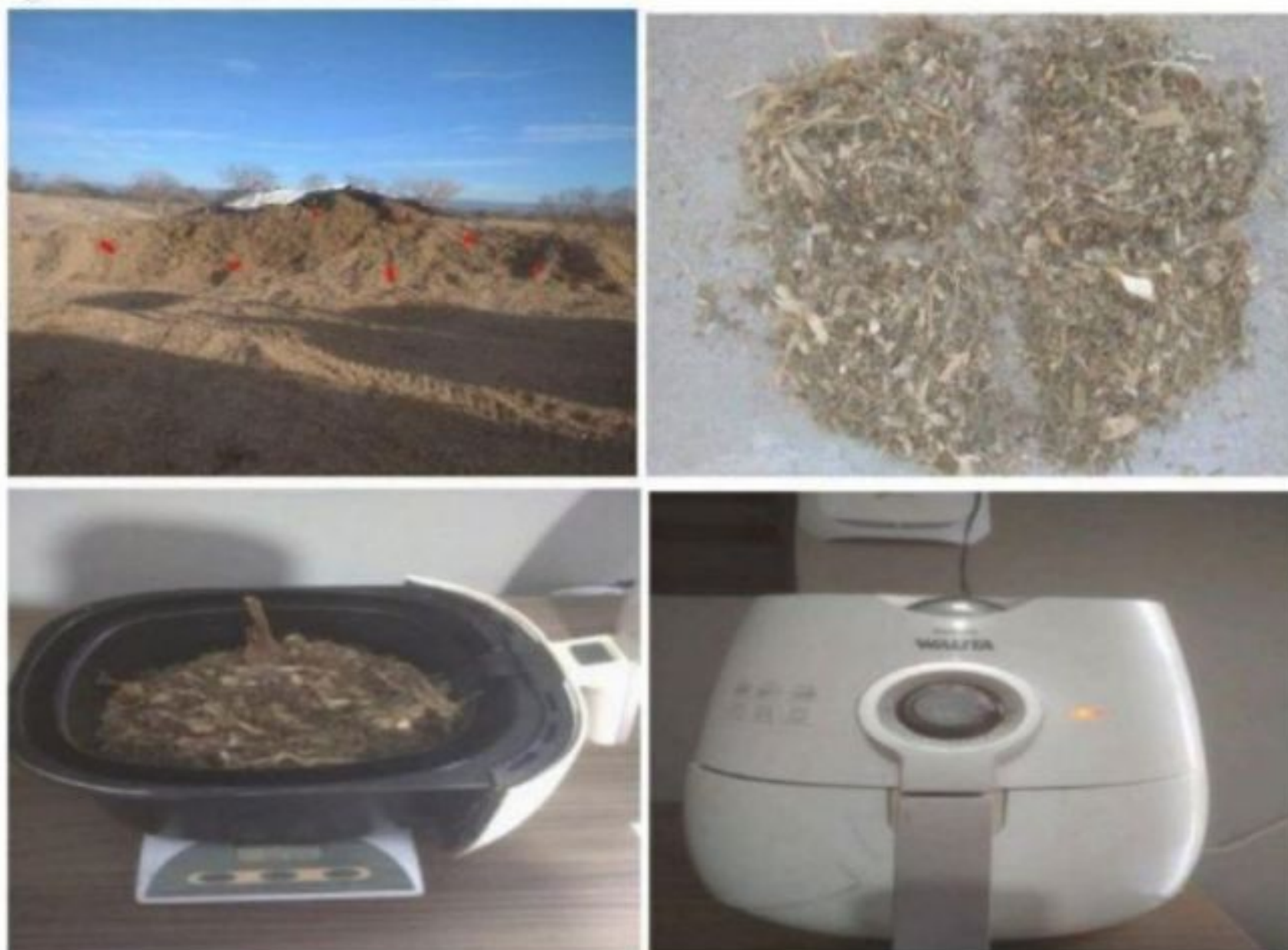
Figura 5 - Análise de Matéria Seca.

A metodologia utilizada consiste na coleta de amostras em 6 pontos diferentes do silo, e em seguida homogeneizada, dividida em 4 partes, e recolhida a quarta parte. Seguindo para a secagem, é retirado a tara do peso do recipiente, e adicionado uma porção da silagem já mensurada. A air fryer é ligada em 120 °C por 30 minutos na primeira secagem, nas seguintes o tempo é reduzido para 5 minutos, até que ocorra uma estabilização do peso.