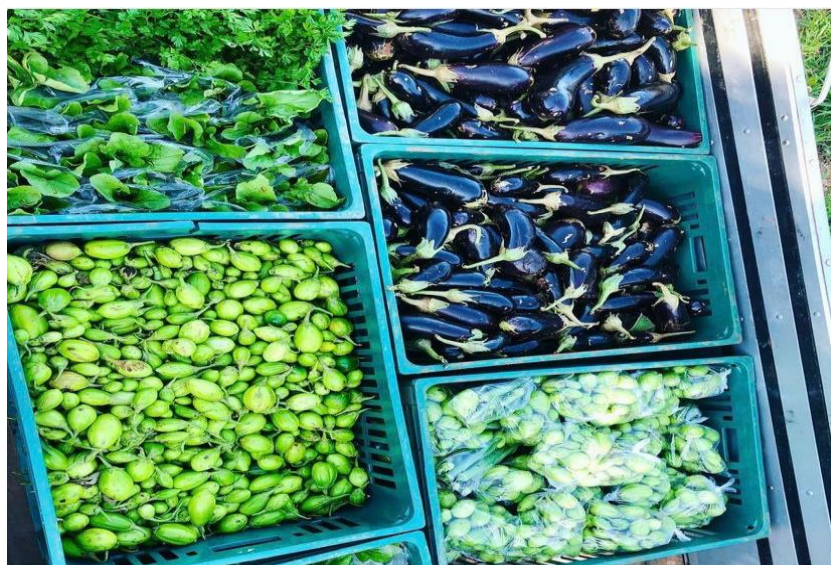
Figura 02. Imagem da distribuição de hortaliça.