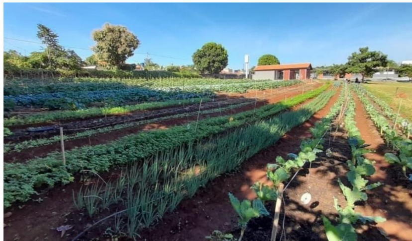
Figura 01. Imagem do Projeto Horta Comunitária pós-instalação.