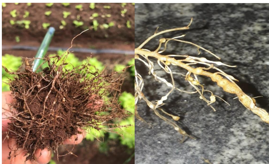
Figura 4.1. Raízes de alface 55 dias após transplante exibindo galhas induzidas por Meloidogyne incognita .

Para a quantificação dos ovos as raízes de alface foram picadas em pedaços de 1 a 2 cm e trituradas em liquidificador na menor rotação com solução de hipoclorito de sódio a 0,5% por 20 segundos. Em seguida, a suspensão resultante foi submetida a um conjunto de peneiras de 200 mesh e de 500 mesh. A suspensão aquosa retida na peneira de 500 mesh foi recolhida em becker de vidro de 200 mL com auxílio de uma piseta (BONETTI & FERRAZ, 1981).