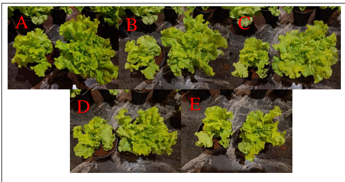
Figura 3.1: Comparação dos tratamentos com os isolados e controle 55 dias após inoculação com 5000 ovos de Meloidogyne incognita . (A) Bacillus amiloliquefaciens , (B) B. subtilis , (C) B. methylotrophicus , (D) Trichoderma harzianum , (E) T. Asperellum .

As avaliações da parte aérea foram realizadas aferindo-se as seguintes variáveis: Massa fresca da parte aérea (MFPA), (g), e massa fresca da raiz (MFRA), (g), em balança analítica digital com duas casas decimais. O comprimento de raiz (C.R.) foi medido da distância da base do corte no caule até a parte apical da raiz, com auxílio de uma régua graduada expressa em (cm); O diâmetro do caule (D.C) foi obtido com auxílio de paquímetro digital expresso em (cm), e as médias foram submetidas à análise de variância e comparadas pelo teste Tukey a 5% de probabilidade, utilizando o programa estatístico Sisvar (FERREIRA 2011).