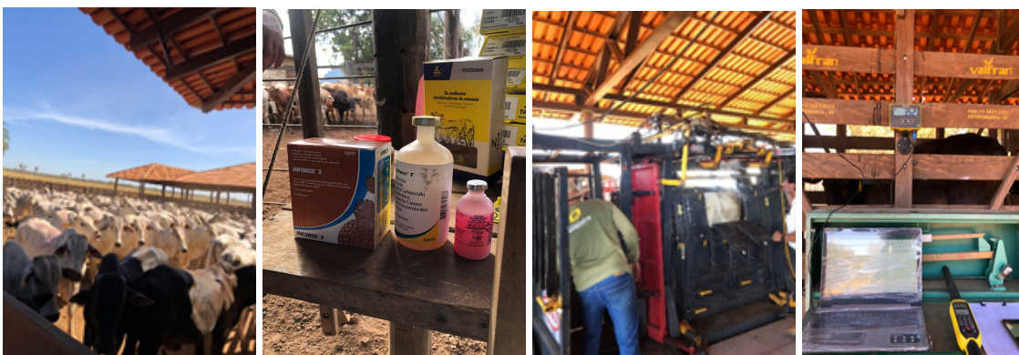
Figura 1. Realização do protocolo nos animais do parceiro.

O protocolo de entrada foi composto por vermifugação (associando dois vermífugos sendo: um a base de doramectina 3,5% e o outro a base de albendazol 1,5% a fim de obter controle de verminoses, em particular a cestódeos da tênias), vacina antirrábica, vacina contra clostridiose, vacina respiratória (contra rinotraqueíte infecciosa bovina e vírus Sincicial respiratório bovino), marcação com ferro incandescente no dorso do animal com o número do lote e pesagem dos animais, os animais apresentaram peso médio de 378,3 kg, formando três lotes, 90 animais em cada. Além dos animais provenientes do boitel, foram introduzidos na área de confinamento dois lotes compostos por 79 novilhas da raça Nelore. O peso médio desses animais foi de 283 kg, conforme ilustrado na (Figura 1).