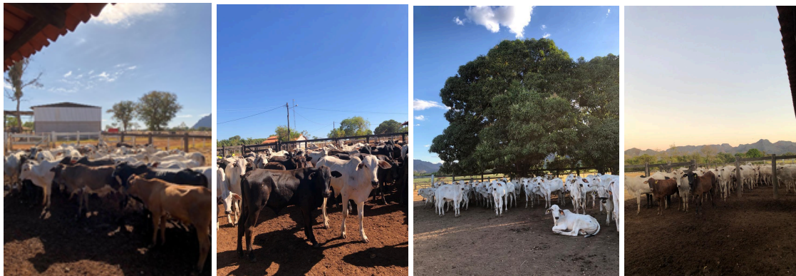
Figura 8. Animais de compra e recria.

possível ter um número real de estoque de gado, já na fazenda Pesqueiro o inventário foi em razão das entradas de animais para a reposição (Figura 8).