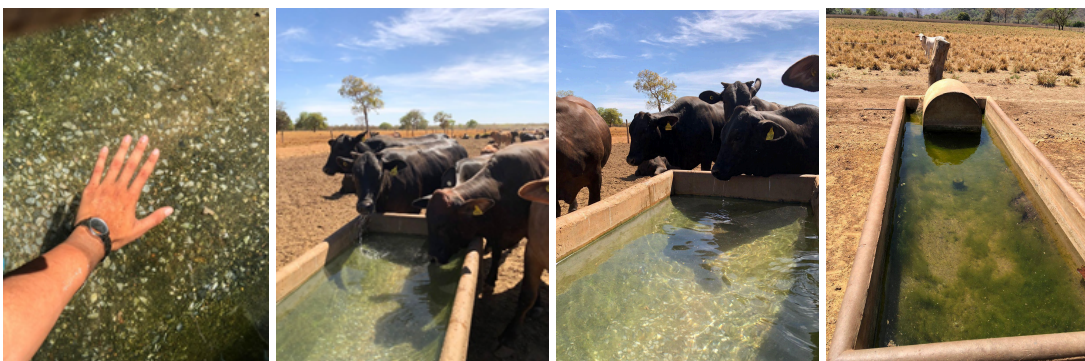
Figura 3. Avaliação das condições da água no confinamento.

O escore da água refere-se à avaliação das condições da água fornecida, desempenhando um papel crucial nos resultados do confinamento. O fornecimento de água com elevado teor de impurezas resulta na redução do consumo de matéria seca. Como medida para contornar essa questão, os bebedouros eram higienizados diariamente, como ilustrado na (Figura 3).