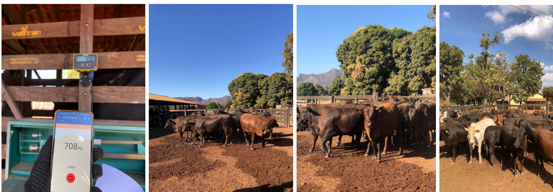
Figura 7. Pesagem e saída dos animais do confinamento.

As novilhas F1 Angus que já estavam no confinamento no início do estágio, começaram serem levadas para o abate (Figura 7), saindo do confinamento com 83 dias de cocho e peso médio igual 523,5, os demais animais que foram inseridos durante o estágio, seguiram confinados na dieta de terminação.