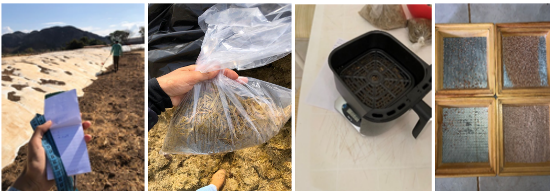
Figura 6. Análise de granulometria do grão de sorgo.