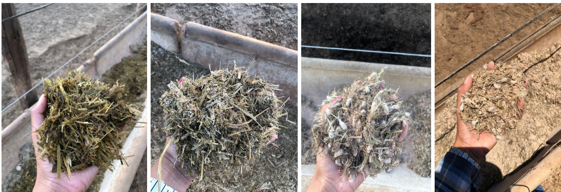
Figura 5. Avaliação das dietas no confinamento.

A dieta para ambos os lotes no primeiro dia foi 100% volumosa, silagem de MG 12, a partir do segundo dia confinado passou para a dieta de Adaptação com fornecimento a 2,4% em relação ao PV, composta por silagem de MG 12, Sorgo moído, torta de algodão, gérmen de milho, núcleo e ureia com duração de 14 dias. Após os 14 dias de adaptação, os animais passaram por uma transição gradativa na dieta para a dieta de Terminação composta por silagem de MG 12, sorgo moído, caroço de algodão, núcleo e ureia (Figura 5).