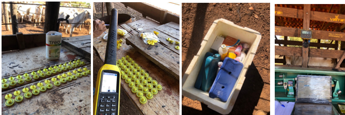
Figura 9. Brincos de identificação e medicamentos.

Dessa forma, todos os animais do rebanho foram conduzidos ao curral para realizar uma série de procedimentos essenciais. Isso incluiu a identificação individual dos animais por meio de brincos numéricos e brincos de chip eletrônico. O protocolo sanitário adotado (conforme mostrado na Figura 9) foi rigoroso, abrangendo vermifugação, vacinação antirrábica, e vacinação contra clostridiose. O lançamento no sistema próprio ocorreu por meio da leitura do chip, brinco numerado, seguido pela pesagem do rebanho e marcação a fogo. Além disso, foram realizados procedimentos adicionais, como a desmama e o ajuste de categorias dentro do rebanho. Este conjunto abrangente de práticas visa garantir a saúde e o bem-estar dos animais, além de aperfeiçoar a gestão do rebanho.