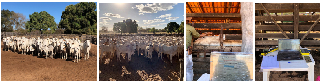
Figura 10. Brincagem de identificação e medicamentos.

O processo de identificação individual dos animais foi composto por animais que não possuíam nenhum tipo de identificação (Figura 10), trata-se de matrizes e a recria sendo animais próprios ou aquisição, nesse sentido, além de ser possível realizar o manejo sanitário, foi possível obter os números precisos de animais a pasto e logo realizar os ajustes. A fazenda Pesqueiro contava com 1264 animais da reposição e na fazenda manga com 758 animais