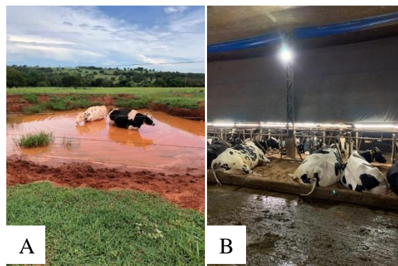
FIGURA 1 - Dois tipos de ambientes (A – Criação à extensiva) e (B – Criação confinada).

Vacas leiteiras em dois ambientes de criação em propriedades rurais do Sudoeste Goiano (Figura 1).