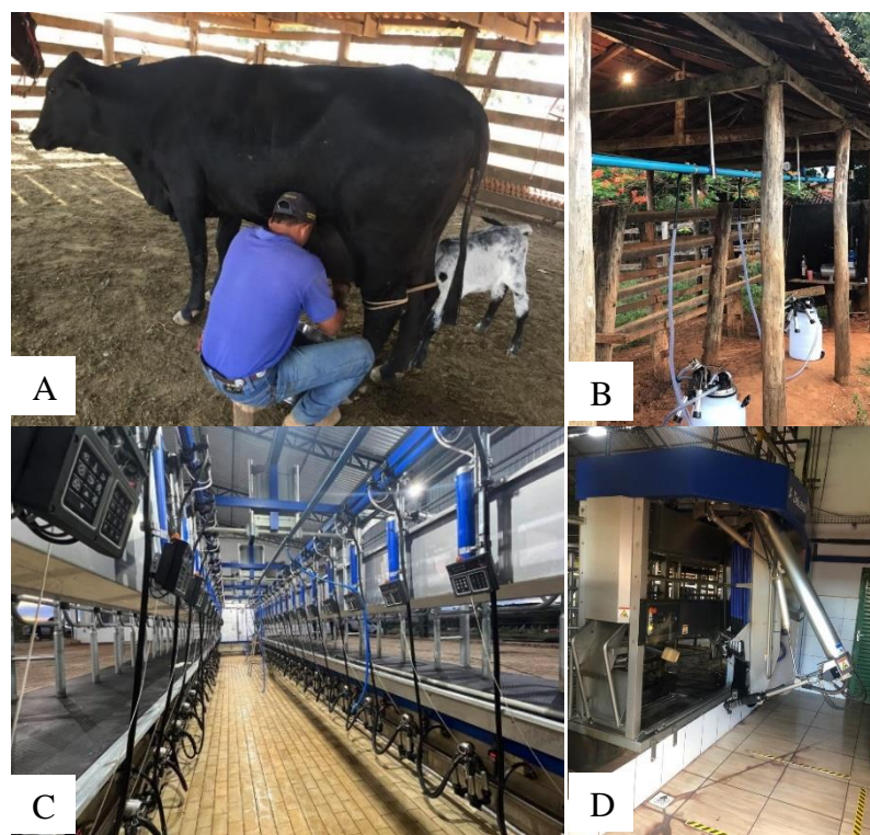
FIGURA 3 - Ordenha manual (A), ordenha mecânica (B - Balde ao pé), ordenha mecânica (C - Canalizada) e ordenha mecânica (D - Robotizada).

Nas Tabelas 5 e 6 demonstram variações da qualidade do leite relacionadas ao tipo de ordenha.