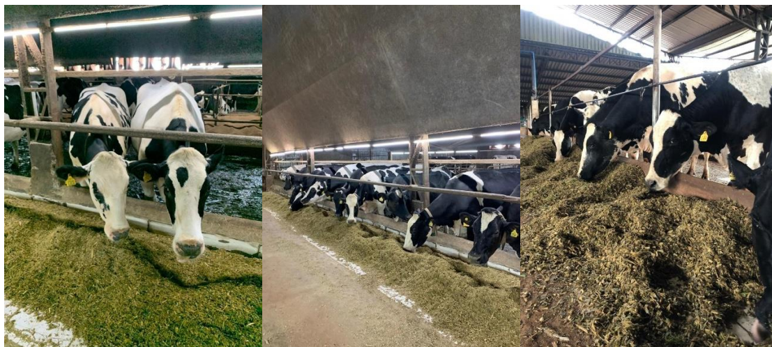
FIGURA 4 – Vacas leiteiras se alimentando de dieta total (silagem).

Vacas leiteiras em sistema de confinamento de modelo cross-ventilation sendo alimentadas com dieta na forma de silagem (Figura 4).